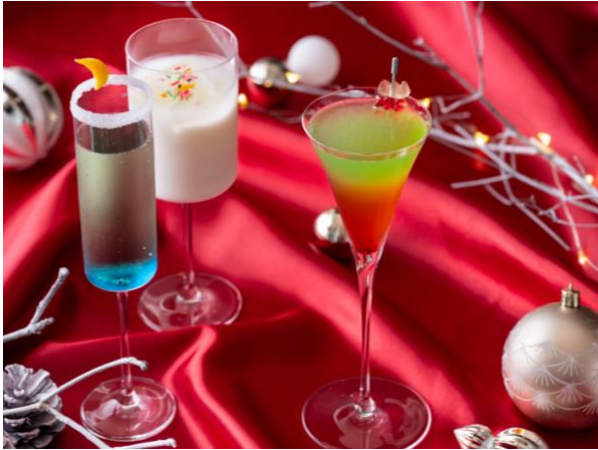
ラブアクチュアリー、ホワイトスノウ、トゥインクルスター ※写真右から