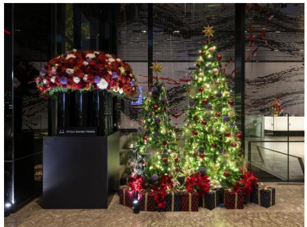
ミレニアム 三井ガーデンホテル 東京