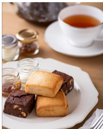
香り豊かな紅茶と楽しむスコーン