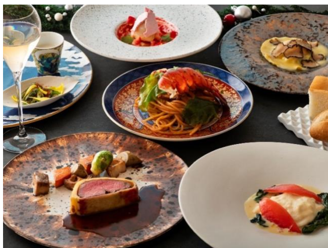
クリスマス期間限定ディナーコース

また、同レストランでは【Xmas2025】苺とチョコレートを使用した Xmas アフタヌーンティーセットもご用意。同フロアのバー「BAR BELLO GATTI」では、クリスマス映画をイメージした 3 種のフェスティブカクテルをご提供しております。みなとみらいの煌めく景色とともに、心華やぐひとときをお過ごしください。