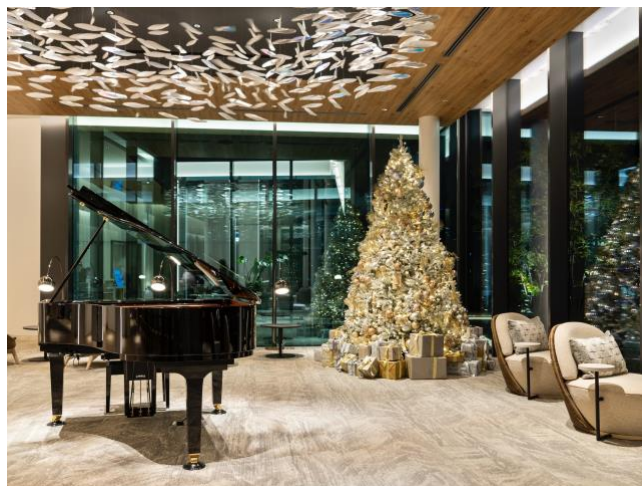
三井ガーデンホテル横浜みなとみらいプレミア ロビー

2025 年のクリスマスは、レモンオイル香るカリフラワースープや寒鰯と春菊のアミューズに始まり、ヒラメの蒸し焼きや濃厚ビスクをまとわせた自家製キタッラ、黒トリュフ香るラビオローネなど華やかな料理が並びます。メインはフォアグラをキャラメリゼした牛フィレ肉のパイ包み焼き。20 階からみなとみらいの夜景を望む特別な空間で、苺のシャンパンマリネとホワイトチョコムースのデザートとともに、心に残るクリスマスのディナータイムをお過ごしください。