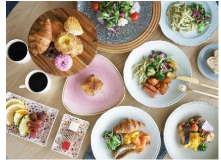
フレンチトーストはライブキッチンで出来立てを提供