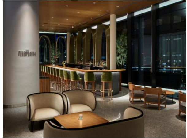
20階 BAR BELLO GATTI (バー ベッロ ガッティ)