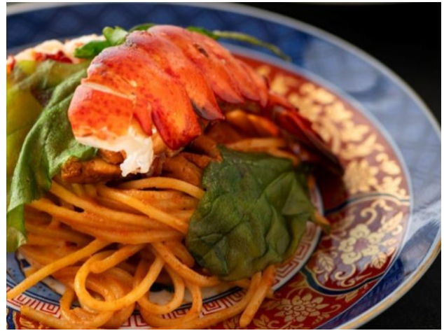
キタッラ ビスクとマスカルポーネソース