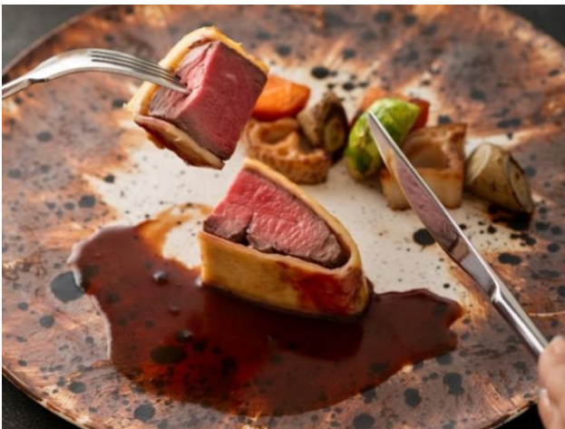
牛フィレ肉のパイ包み焼き