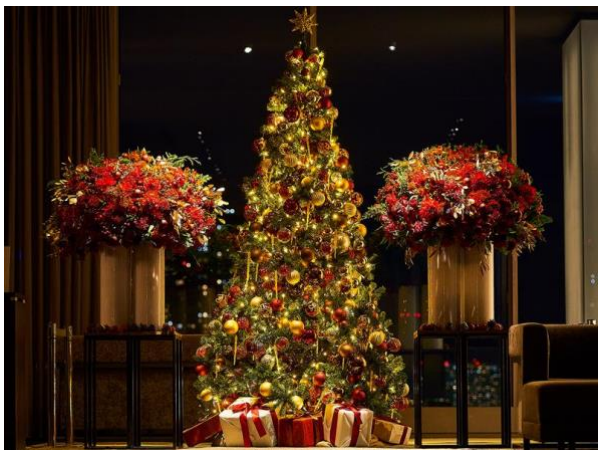
三井ガーデンホテル銀座プレミア

https://www.gardenhotels.co.jp/campaign/anniversary/