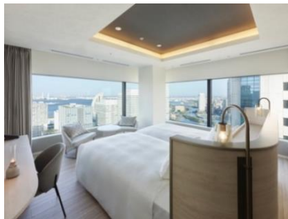
客室エグゼクティブコーナーツイン（46.1 m 2 ）