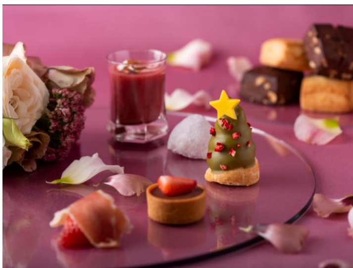
クリスマスの華やぎをイメージしたアフタヌーンティー

薫り高いコーヒーや紅茶はもちろん、リラックス効果のあるハーブティー、奥深い味わいの中国茶など、料理に合わせた多彩なドリンクをフリーフローでご用意しております。お料理やスイーツとのペアリングをお楽しみください。 ※仕入れ状況によりメニューが変わる場合がございます